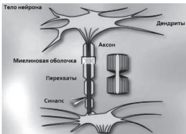
Рис. 1. Нейрон и синапс. Нарушение целостности миелиновой оболочки

правленной на усиление созревания и пролиферации клеток предшественников эритроидного ряда [2, 4, 5, 8, 10, 15, 17].